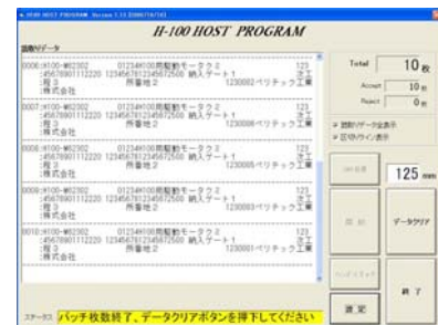
専用ソフトメイン画面