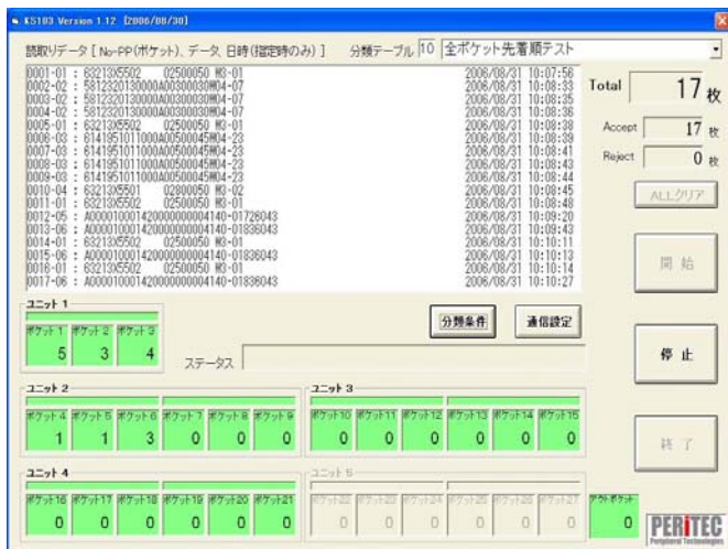
分類条件設定画面