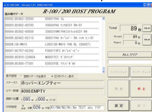
読取ソフトメイン画面