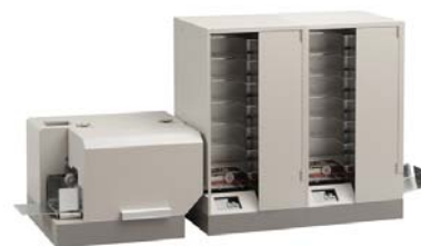
12 ポケット構成 (R202 接続時)

基本 6 ポケットから 6 ポケット単位 で増設可能。最大 30 ポケット。 運用に合わせた構成が選択可能。