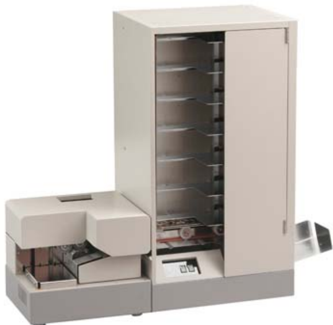
6 ポケット基本構成 (R100 接続時)